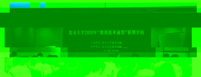
北京大学2010年“教育技术前沿”暑期学校

本期暑期学校圆满成功，学员纷纷表示受益匪浅。北京工业大学、清华大学、北京师范大学等单位的领导、教师、学员代表参加了结业典礼。